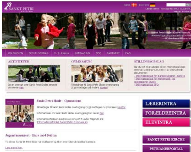
Im neuen Outfit, die Homepage