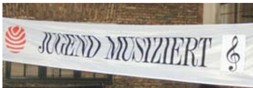
Banner im Kirchhof