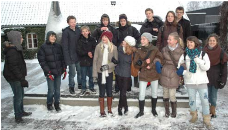
8a foran Louisiana