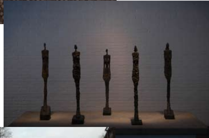
Billeder fra Louisiana