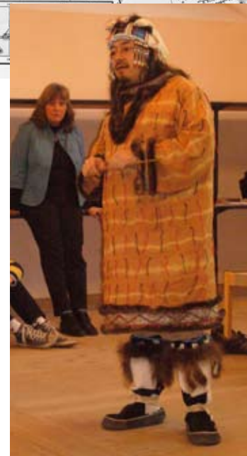
Traditionelle Kleidung aus Alaska