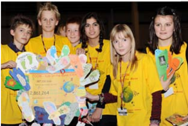
Climate Alliance's "ZOOM-Kids on the Move" campaign shows that children can take steps to help protect the climate too.